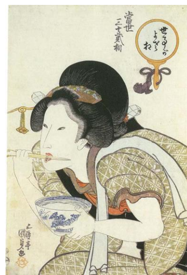
当世三十二相 世事がよき相 歌川国貞

みなさん、歯にはさまっている汚れは、歯ブラシだけで取れていると思いませんか？ 実は、 歯と歯の間の汚れは、歯ブラシだけでは58%くらいしか除去できないのです。