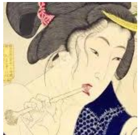
めがさめさう 月岡芳年